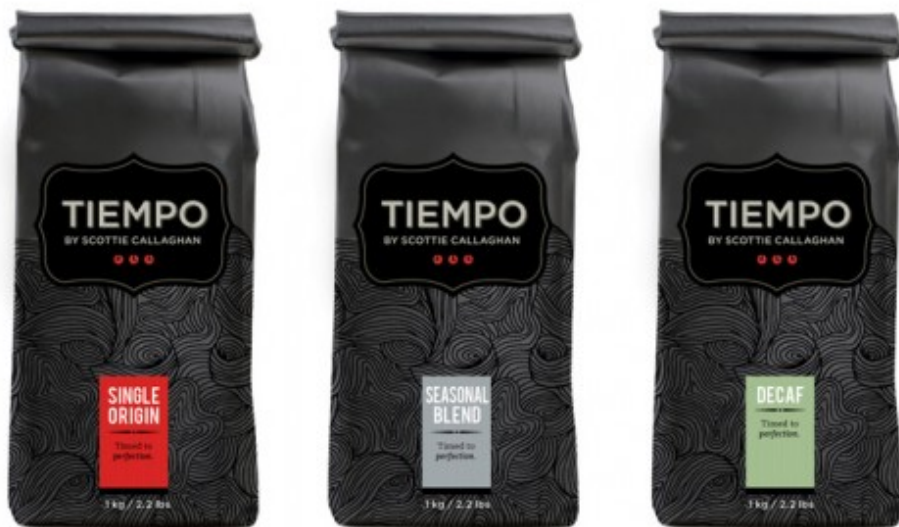
ภาพที่ 3.2 แสดงผลงานออกแบบบรรจุภัณฑ์ชั้นนอกโดยตุงรสเอสเพรสโซ่ คาปูชิโนและอเมริกันโน