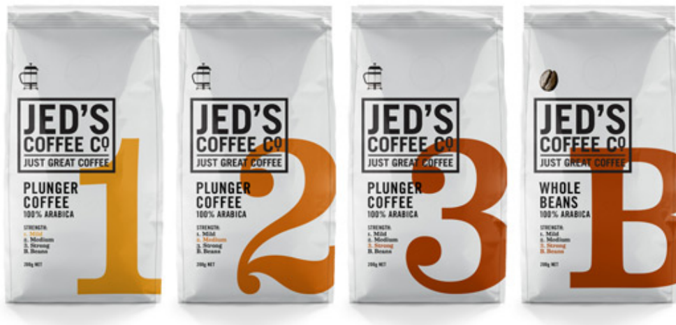
ภาพที่ 3.1 การแสดงผลงานออกแบบบรรจุภัณฑ์ชั้นในดอยตุงรสเอสเพรสโซ่ คาปูชิโนและอเมริกันโน